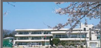
高崎市立下里見小学校 1,200m