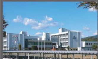
高崎市立榛名中学校 4,300m