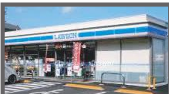
ローソン高崎下里見店 460m