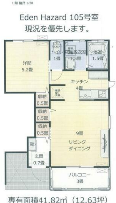
専有面積41.82m 2 (12.63坪)