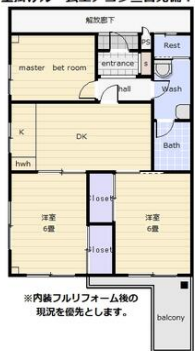
シーザーレジデンス高崎 II 1004 壁掛けルームエアコン三台完備！

バイク置場有(無料),駐輪場有(無料),主要採光面：南向き,ペット相談 小型犬可猫可,B・T別,シャワー,トイレ,洗面所,シャワー付洗面化粧台,洗面所独立,ガスコンロ付,独立型キッチン,システムキッチン,収納スペース,全居室収納,室内洗濯機置場,洗濯機置場,都市ガス,全居室エアコン,バルコニー,エレベーター