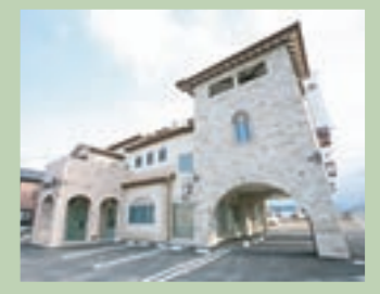
弊社外観 (火曜定休) (打ち合わせルーム多数有り)