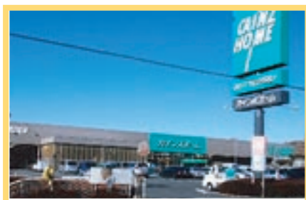
カインズホーム玉村店 800m