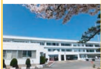
玉村町立南中学校 1,000m