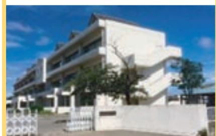
玉村町立南小学校 1,000m