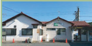
JR 井野駅 700m