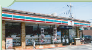
セブンイレブン高崎井野けやき通り店 500m