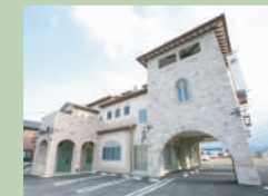
弊社外観 (火曜定休) (打ち合わせセルーム多数有り)