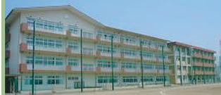
高崎市立中尾中学校 600m