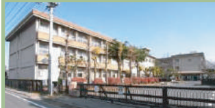
高崎市立新高尾小学校 1,000m