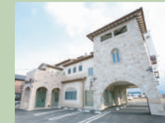
弊社外観(火曜定休) (打ち合わせセルーム多数有り)