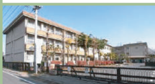
高崎市立新高尾小学校 1,000m