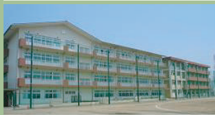
高崎市立中尾中学校 600m