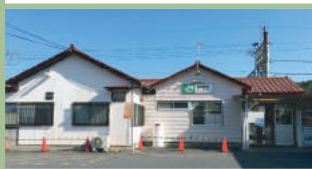
JR 井野駅 700m