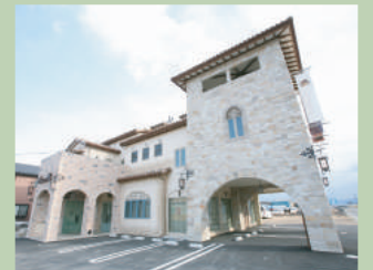
弊社外観 (火曜定休) (打ち合わせルーム多数有り)