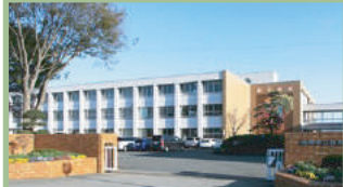
高崎市立群馬南中学校 2,100m