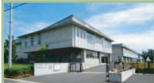
高崎市立桜山小学校 900m