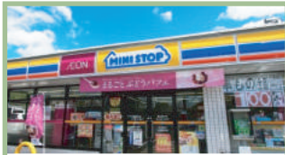
ミニストップ高崎菅谷町店 500m