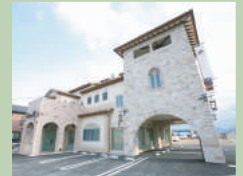
弊社外観 (火曜定休) (打ち合わせセルーム多数有り)