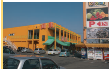
プロムナード両水様 500m

物件概要 宅地造成、上下水道、都市ガス完備の区画整理地内 寺尾小学校・寺尾中学校区域の希少住宅用地。