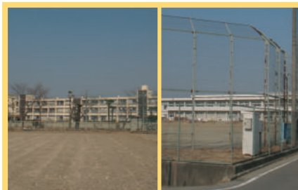
寺尾小学校・中学校 600m