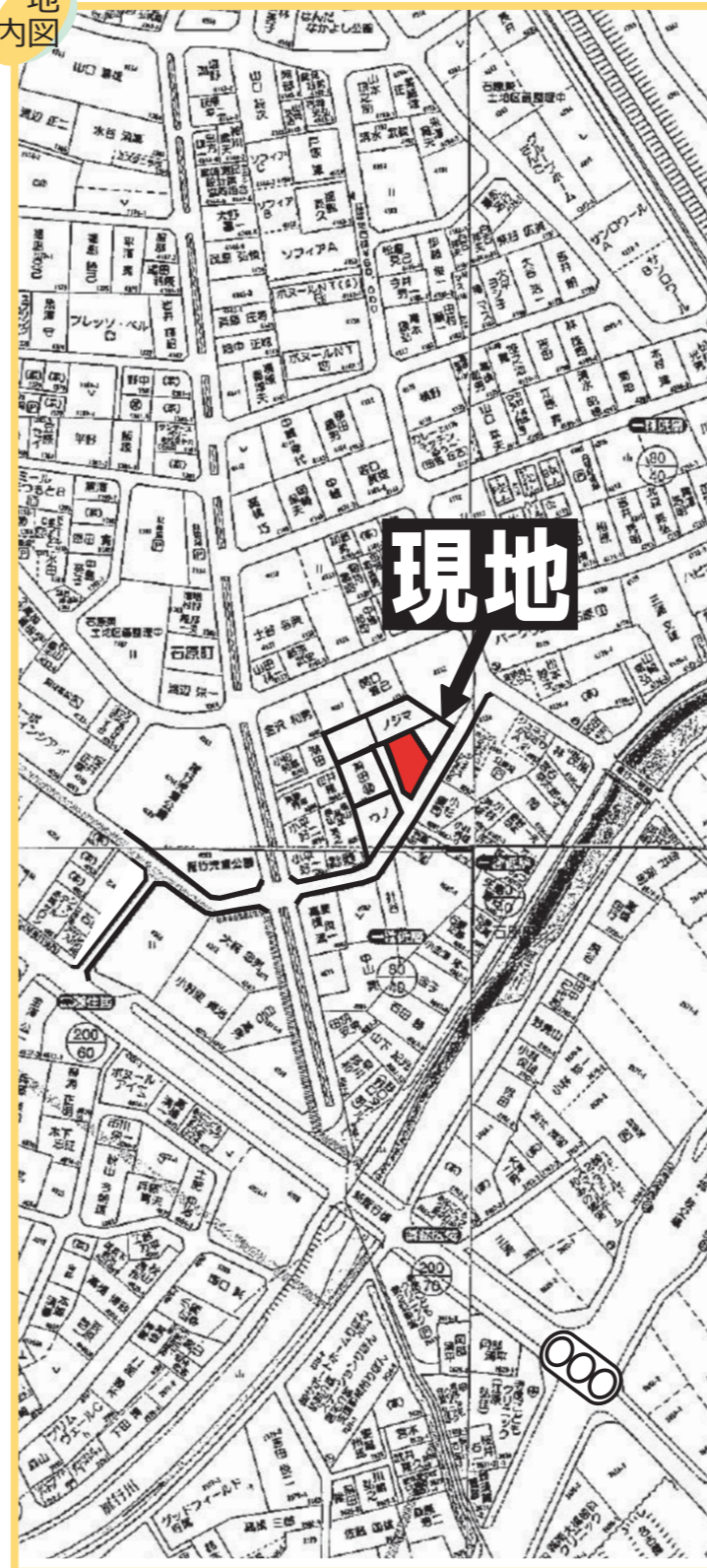
カーナビ検索：高崎市石原町 4097