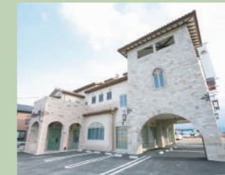
弊社外観 (火曜定休) (打ち合わせルーム多数有り)