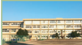
安中市立第二中学校 1,800m