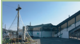
JR 磯部駅 1,500m