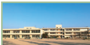
安中市立磯部小学校 300m