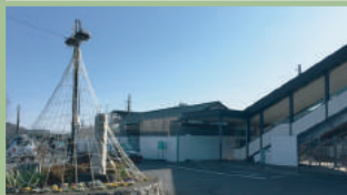
JR 磯部駅 1,500m