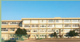
安中市立第二中学校 1,800m