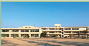
安中市立磯部小学校 300m