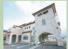
弊社外観 (火曜定休) (打ち合わせルーム多数有り)