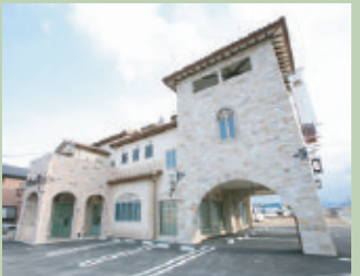
弊社外観 (火曜定休) (打ち合わせルーム多数有り)