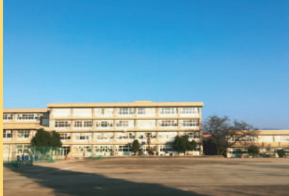
安中市立第二中学校 800m