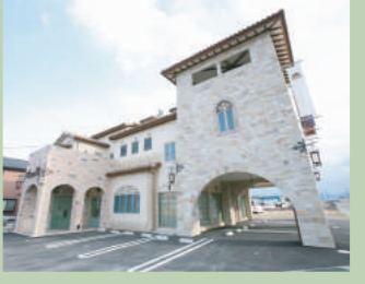
弊社外観（火曜定休） （打ち合わせルーム多数有り）