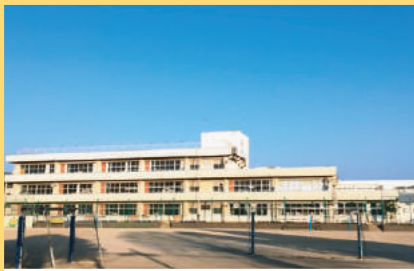
安中市立原市小学校 800m